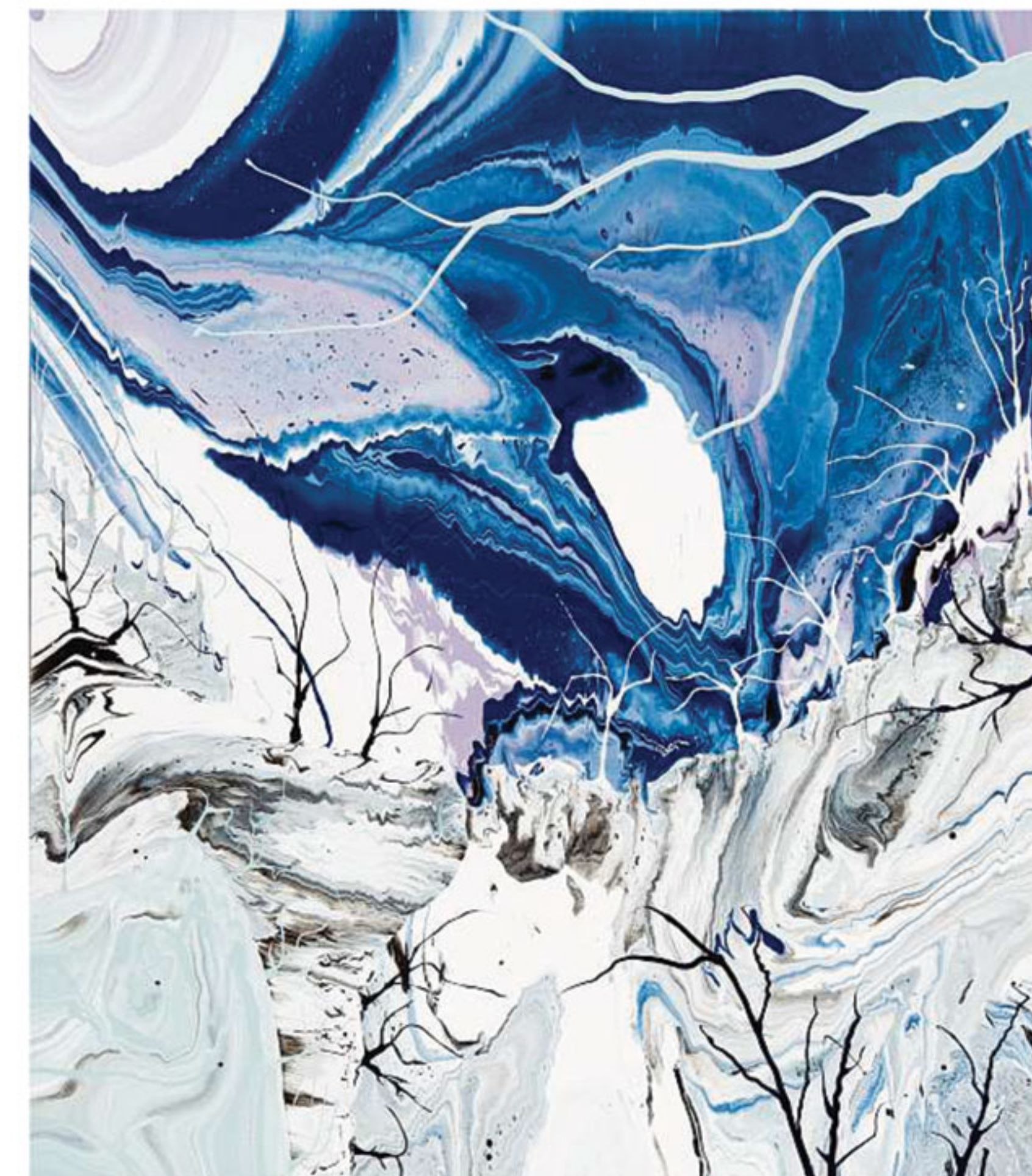
'APOCALYPSE ZERO.8M'. Esmalte sobre tela.