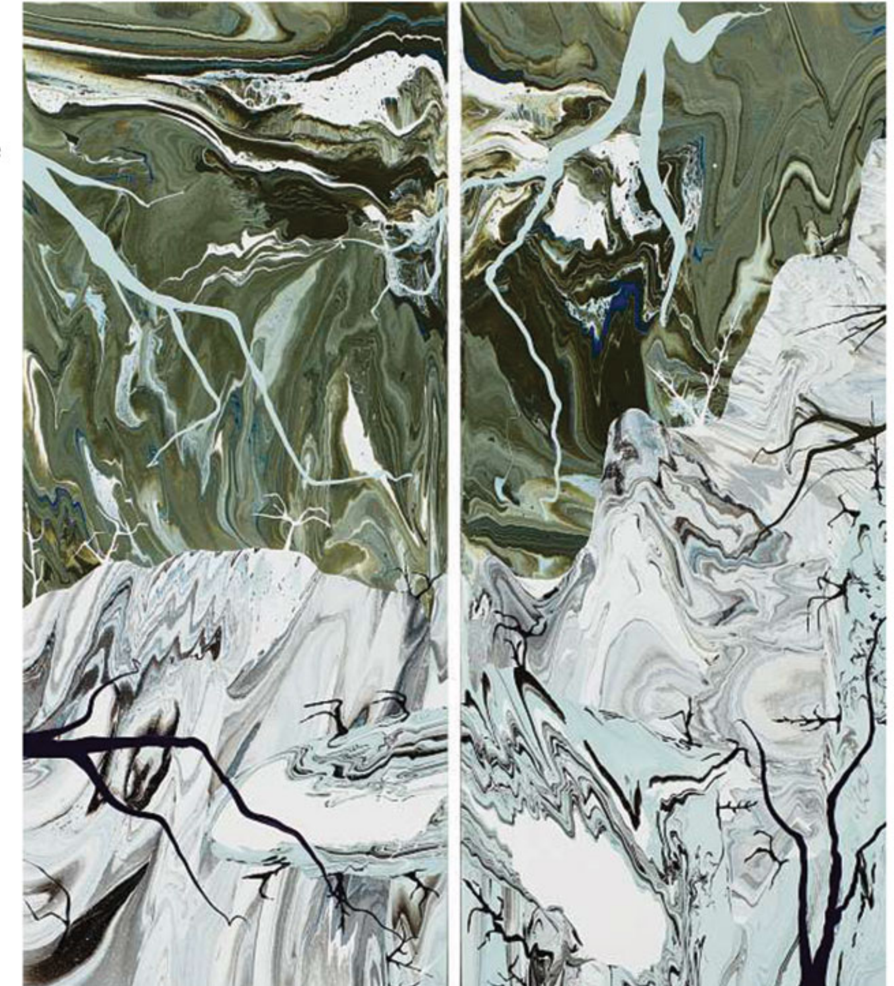
'APOCALYPSE ZERO.10M'. Esmalte sobre tela.

y concibe un tejido cromático rico en texturas debido a las diferentes capas que se acumulan en el proceso. Este artificio de formación