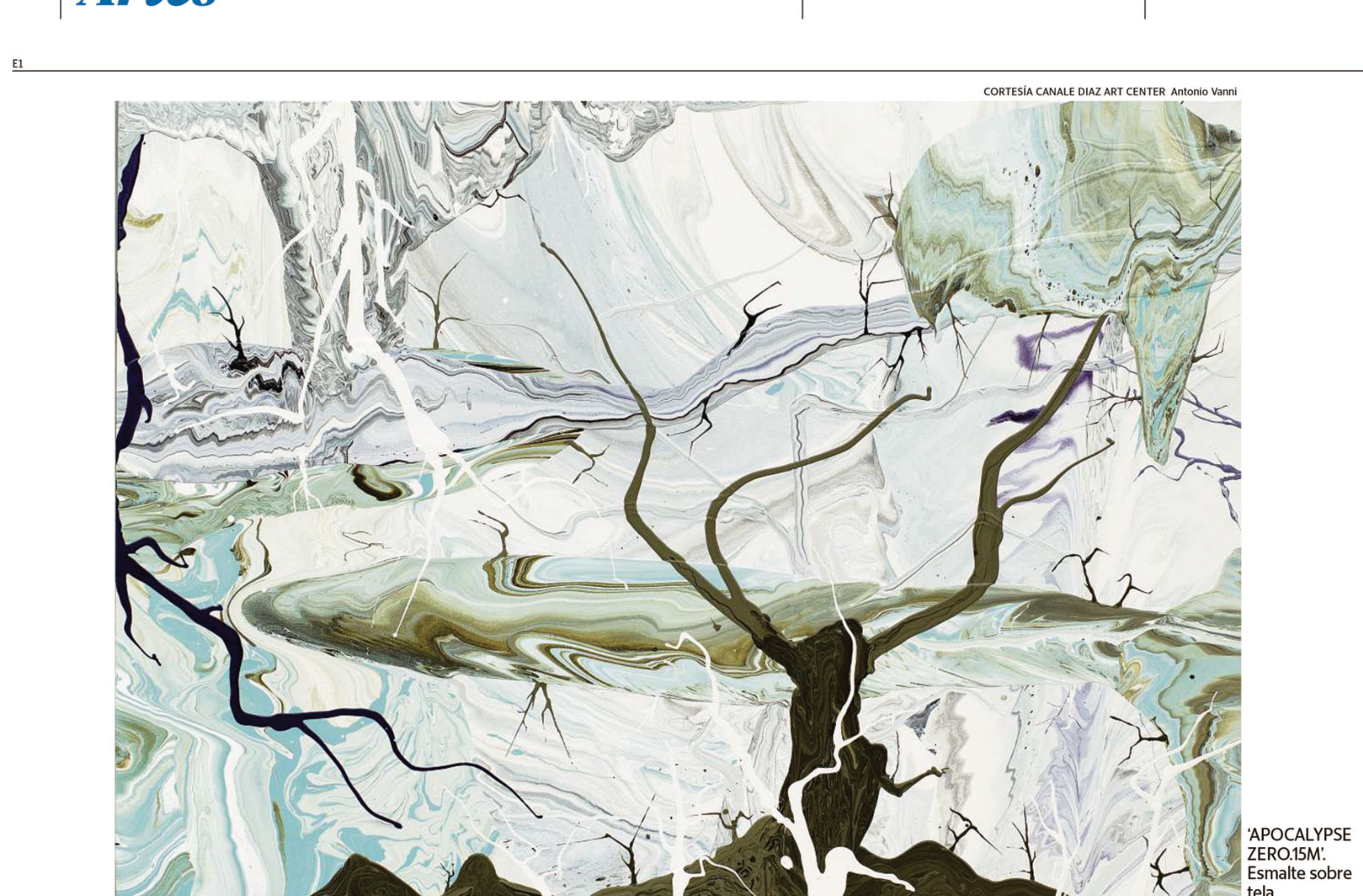
'APOCALYPSE ZERO.15M'. Esmalte sobre tela.

Doris Salcedo / PAMM Hasta el 17 de julio el público de Miami