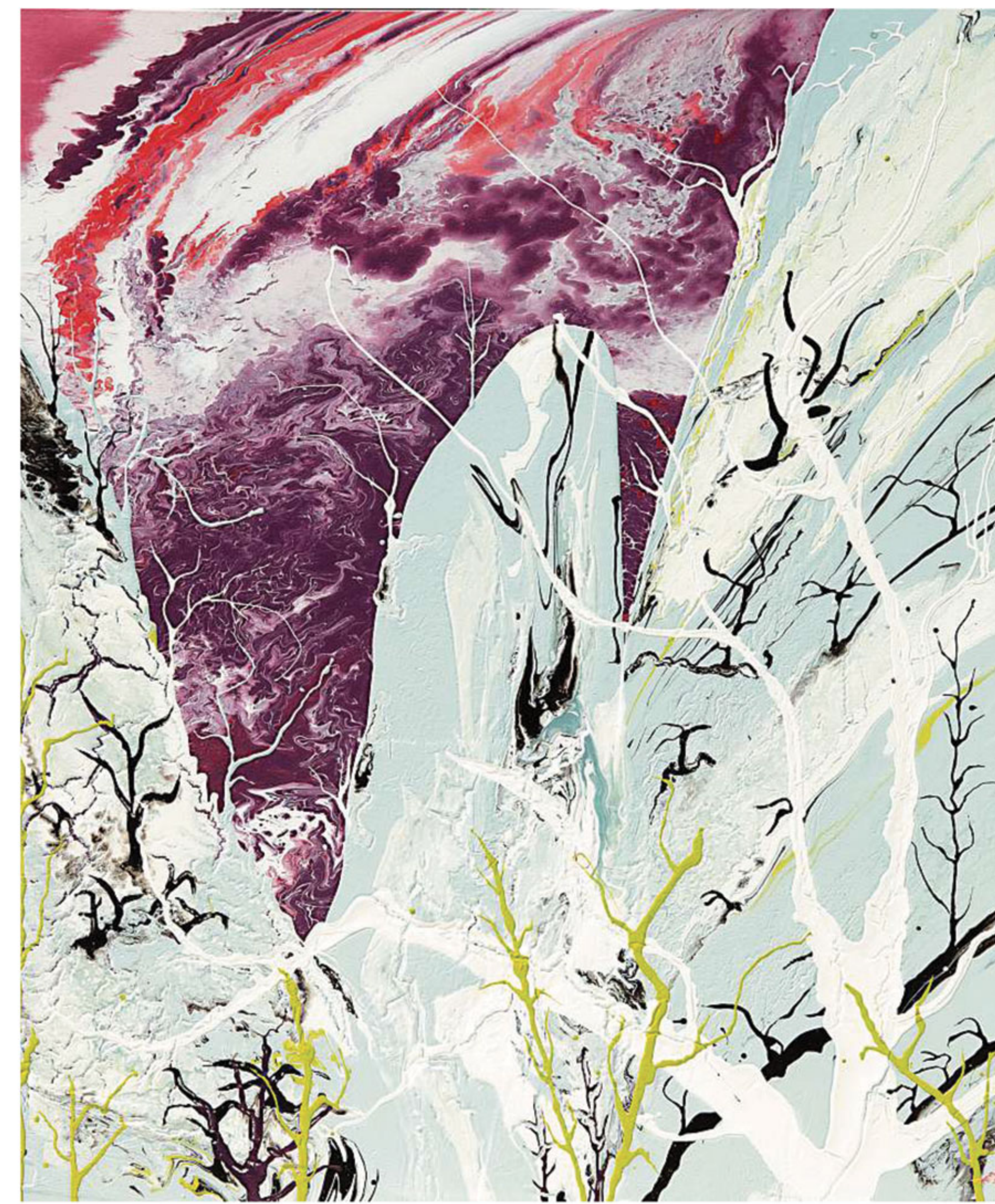
'APOCALYPSE ZERO.6M'. Esmalte sobre tela.

Para ese viaje introspectivo escogió el camino de la abstracción, la cual le permite evadir la realidad, anidando en una suerte de paisajes místicos, rincones donde escucha los ecos de su propia voz; ejercicio que conduce al fortalecimiento de la voluntad y del espíritu. Todo esto se expresa mediante líneas quebradas, multidireccionales, parecidas a relámpagos que cruzan el lienzo como si se tratara de una visión íntima del caos, tensión entre las fuerzas del bien y el mal. Prima en estas obras el blanco, el azul y