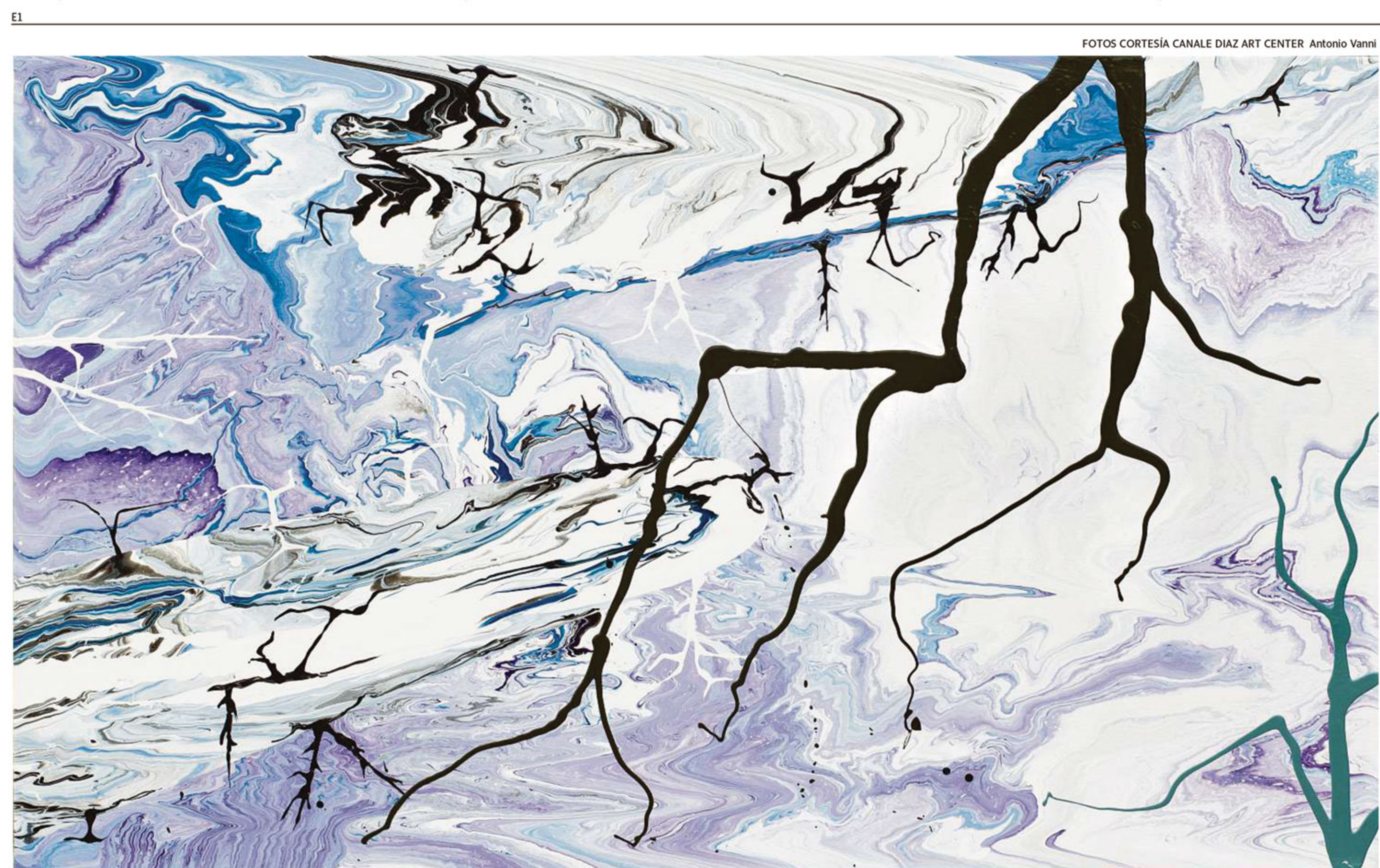
'APOCALYPSE ZERO.12M'. Esmalte sobre tela.