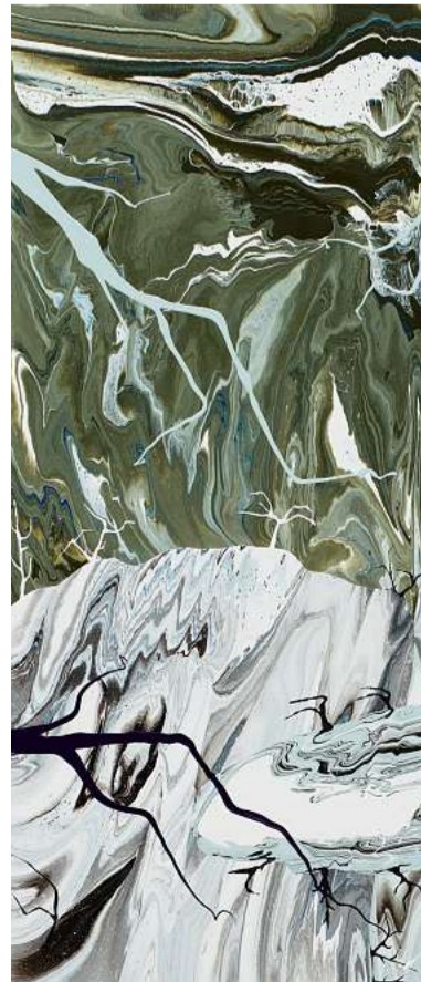
'APOCALYPSE ZERO.10M'. Esmalte sobre tela.