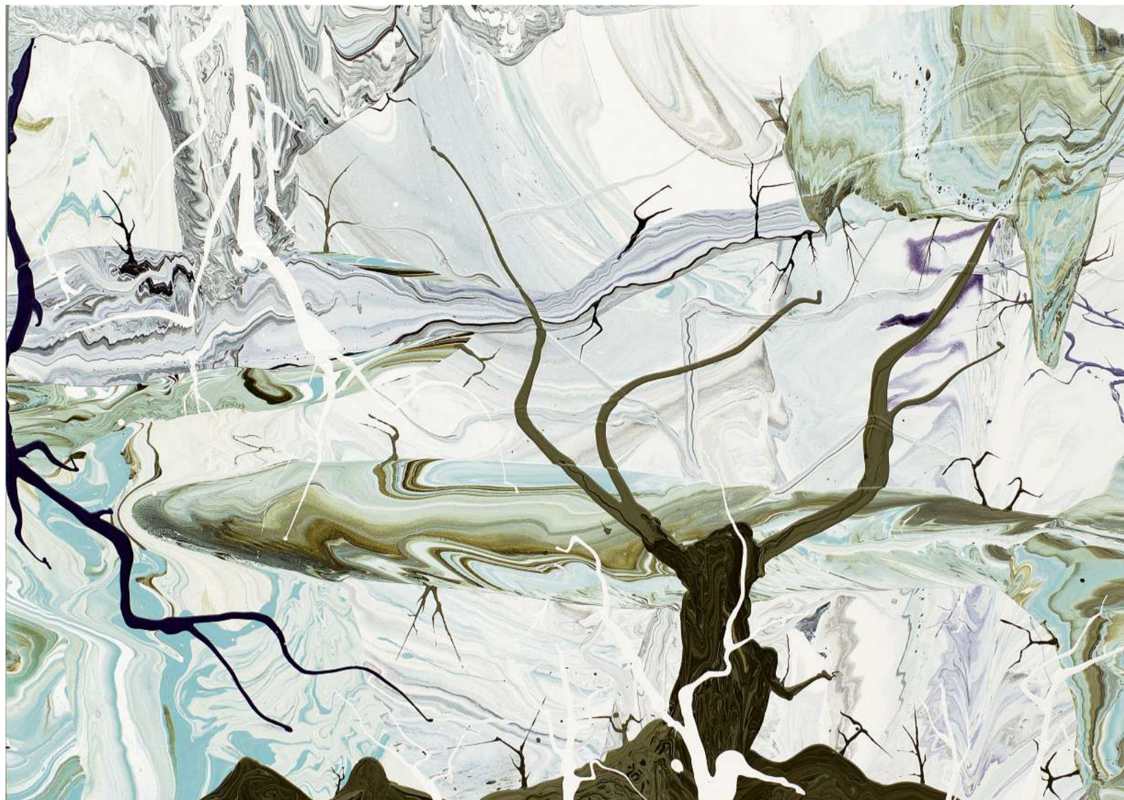
'APOCALYPSE ZERO.15M'. Esmalte sobre tela.

CORTESÍA CANALE DIAZ ART CENTER Antonio Vanni