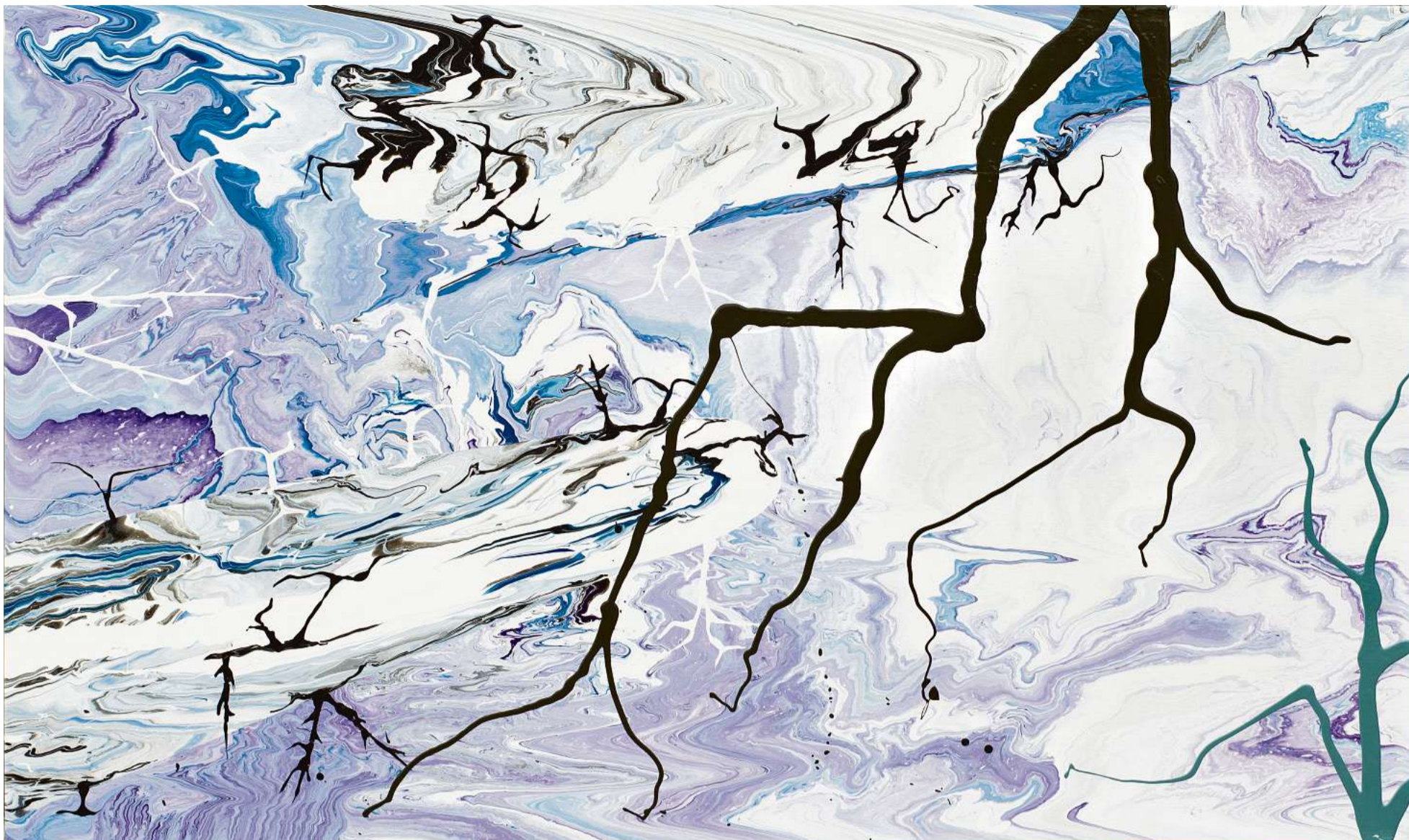
'APOCALYPSE ZERO.12M'. Esmalte sobre tela.

FOTOS CORTESÍA CANALE DIAZ ART CENTER Antonio Vanni