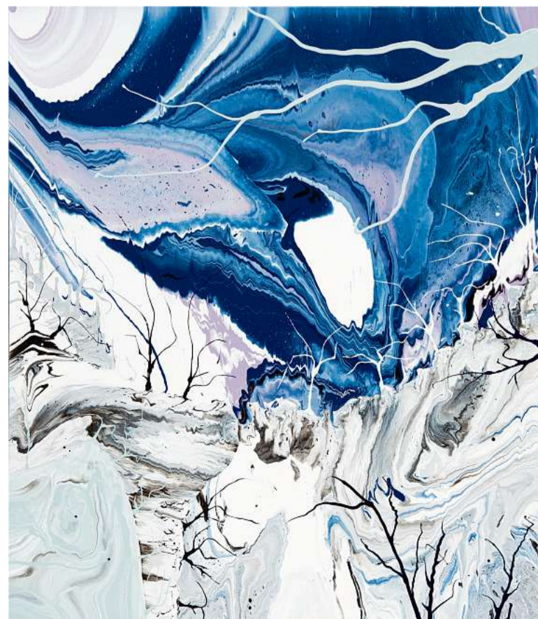
'APOCALYPSE ZERO.8M'. Esmalte sobre tela.

CORTESÍA CANALE DIAZ ART CENTER Antonio Vanni